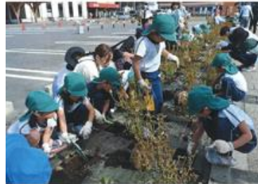
●東日本大震災復興事業 (大槌町)