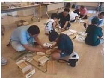
●木工工作キット配付事業 (大槌町)