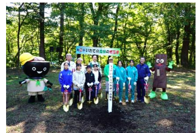
●第14回いわての森林の感謝祭 (矢巾町)