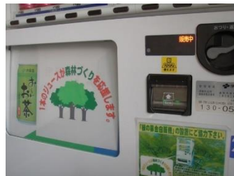
緑の募金「自動販売機」