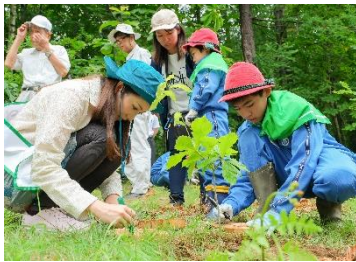
●第55回岩手県緑の少年団大会 (岩手県県民の森)