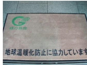
緑の募金「玄関マット」