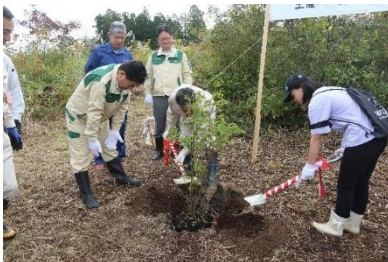
●一関地方育樹祭 (一関市)