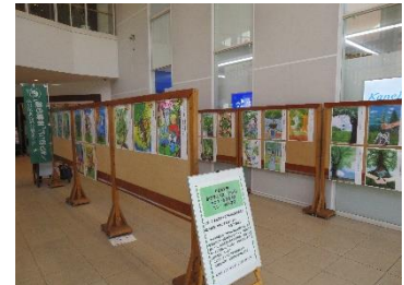
●国土緑化運動・育樹運動ポスター原 画岩手県コンクール入賞作品展示会 (クロステラス内展示)