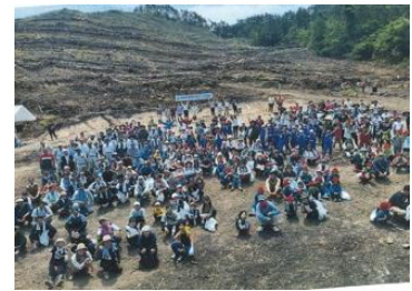
●遠野市緑化祭 「里山フェスタ2024」