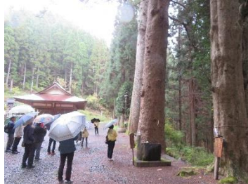
●ふるさとの巨樹・名木観察会 (宮古市・山田町)