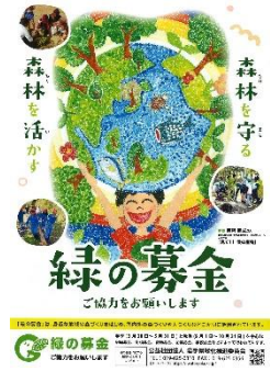
ポスター掲示 (2025年版)