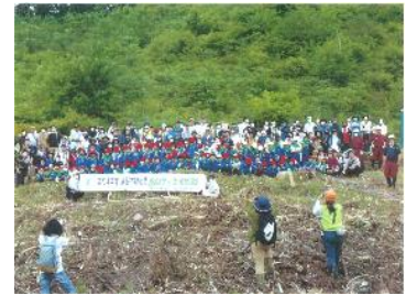
●遠野市緑化祭 「里山フェスタ2022」