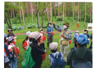
●森林環境学習の推進 (岩手町川口学童保育クラブ)