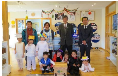
●ユリノキ積木等贈呈事業 (沿岸部幼稚園等)