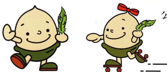
「緑の募金」キャラクター どんぐり君・どんぐりちゃん

森林を守り育てていくためには、個人や企業等、多くの方々の力がが必要です。皆様の私たちの活動への参加と「緑の募金」へのご協力をお願いします。