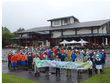
●ボランティアによる下草刈り (岩手県県民の森)