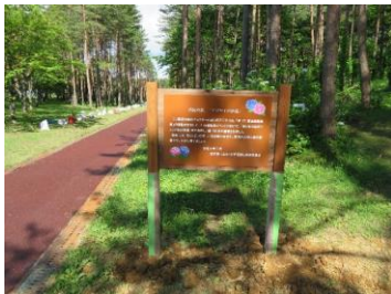
●第73回全国植樹祭イベント 連携事業(八幡平市)