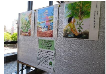
●国土緑化運動・育樹運動 ポスター原画岩手県コンクール 【盛岡駅構内展示】