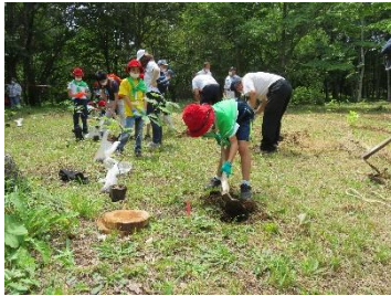
●第53回岩手県緑の少年団大会 (岩手県県民の森)