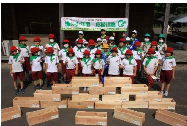
●植樹祭環境整備事業 プランターカバー製作 (岩手県県民の森)