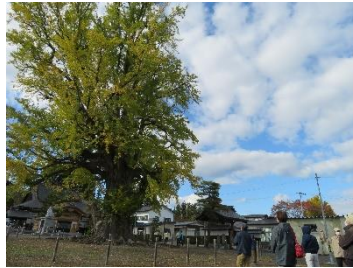
●ふるさとの巨樹・名木観察会 (二戸地区)